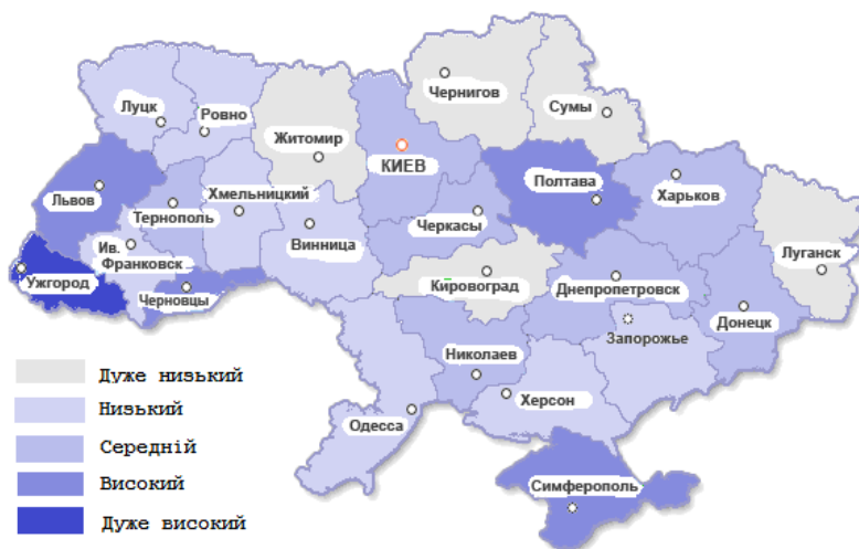
Рис. 3. Картограма розподілу регіонів України за рівнем регіонального людського розвитку у 2004 році

Так, у 2004 році найбільша кількість областей України (20%) потрапила до групи з низьким рівнем людського розвитку, найгірший показник спостерігався у Чернігівській області (рис. 3).