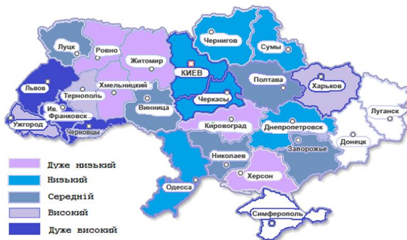
Рис. 5. Картограма розподілу регіонів України за рівнем регіонального людського розвитку у 2017 році

Найгірший рівень людського розвитку спостерігався у Житомирській області. Також слід зазначити збільшення кількості областей з дуже високим рівнем людського розвитку. Якщо у 2004 році до цієї групи потрапила лише одна область, то у 2010 році сім областей. Найвищий рівень спостерігався у Харківській області. Найбільша кількість областей у 2010 році (32%) потрапили до групи з середнім рівнем людського розвитку [7]. Але така позитивна тенденція спостерігалась не довго.