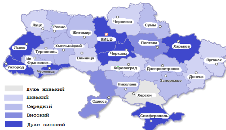
Рис. 4. Картограма розподілу регіонів України за рівнем регіонального людського розвитку у 2010 році

У 2010 році спостерігається деяке покращення показників, що характеризують рівень людського розвитку в Україні: скоротилась кількість областей, що мають дуже низькій та низький рівень.