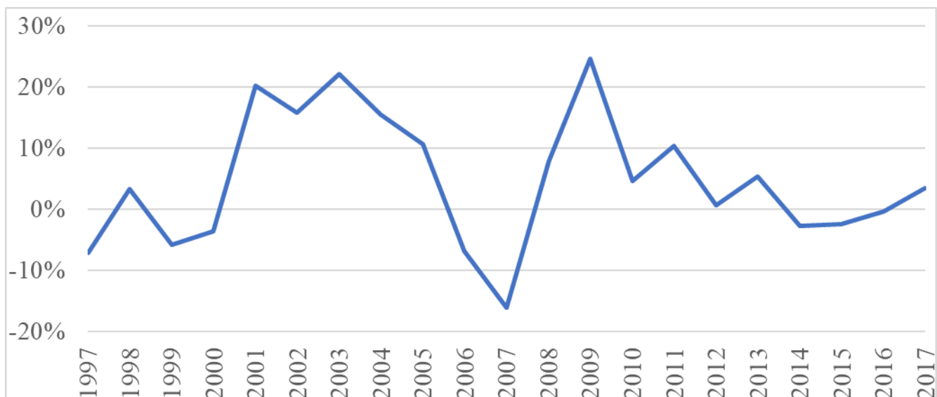
Рис. 2 Динаміка темпу приросту маси прибутку корпорацій у США, 1997-2017 р.р., % [складено автором за 1, 2]

Виходячи з викладеного слід зазначити що поняття фінансиалізації носить скоріше описовий характер, дозволяє узагальнити різні емпіричні дані та виділити тенденцію до підсилення ролі та значення фінансової системи в розподілі створеної додаткової вартості; в той же час «фінансиалізація» не може використовуватися як аналітичний інструмент, тому що таким чином той факт, що вихідною причиною утворення та бурхливого росту «фінансових бульбашок» є проблеми нагромадження капіталу в реальному секторі економіки – через тенденцію норми прибутку до зниження – виявляється прихованим.