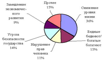
Рис.1. Наслідки корупції на думку респондентів, 2017г.

Приблизно одна третина респондентів вважає, що корупція веде до зниження рівня життя. Менше, але майже однакове число респондентів вказує на те, що корупція дозволяє багатим багатіти, а бідних робить ще біднішими, що вона загрожує державній безпеці, зазіхає на права людини і уповільнює економічне зростання.