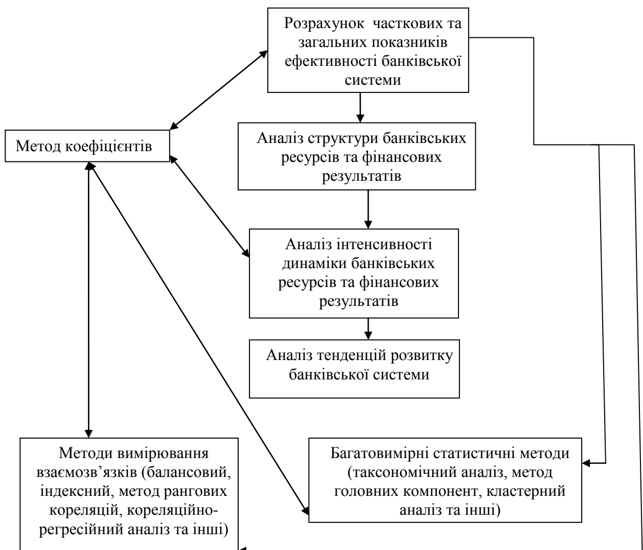
Рис. 1 – Алгоритм статистичного оцінювання ефективності банківської системи України

Виклад основного матеріалу дослідження. Методологія статистичного аналізу ефективності банківської системи реалізується через її науковий апарат, який являє собою сукупність прийомів дослідження. Саме комплексність категорії «ефективність банківської системи» покладено в основу розробки процедури статистичного оцінювання банківської системи. Процедура складається з таких етапів: 1) розрахунок загальних та часткових показників ефективності банківської діяльності на підставі даних статистичної та фінансової звітності; 2) аналіз структури та динаміки основних показників банківської діяльності; 3) аналіз інтенсивності динаміки та тенденцій розвитку банківської системи; 4) коефіцієнтний аналіз; 5) вимірювання взаємозв'язків; 6) багатовимірний статистичний аналіз (див. рис. 1). Кожен з етапів має свої класичні методи та прийоми статистичного аналізу, які можуть перетинатися чи поєднуватися в залежності від мети дослідження та характеру інформації. Більш того, кожен етап може бути самостійним напрямом дослідження.