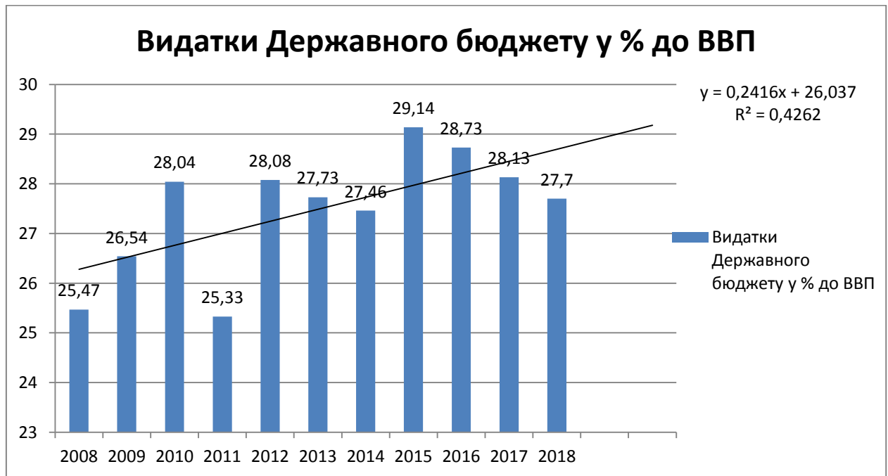
Рис. 3.2. Прогноз видатків Державного бюджету до ВВП у %

(відповідно даних технічної підтримки MS WORD). Так, у 2008 році співвідношення дорівняло 24,44%, у 2009 році – 22,96%, у 2010 році – 22,23%, у 2011 році – 23,9 %, у 2012 році -24,56%, у 2013 році -23,31%, у 2014 році – 22,79%, у 2015 році – 27,01%, у 2016 році – 25,86%, у 2017 році – 26,59%, у 2018 році – 26,08%. Згідно складеного рівняння ми дійшли висновку, що в 2020 році співвідношення повинне дорівнювати 27,05%.