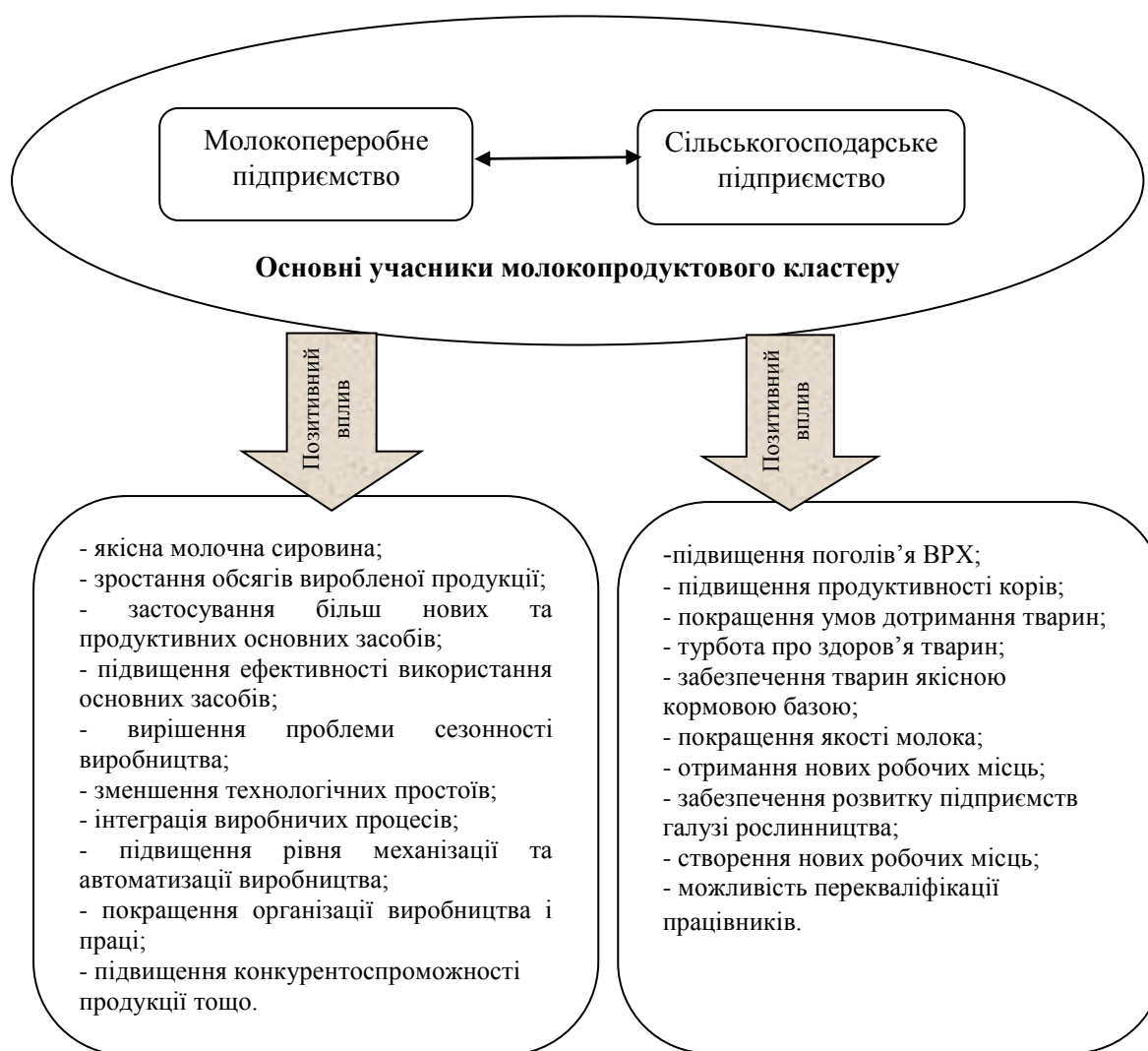
Рисунок 4 – Позитивні наслідки від створення молокопродуктового кластеру для його учасників

Об'єднання молокопереробних підприємств із сільгосппідприємствами, фермерськими господарствами та агропідприємствами дасть змогу збільшити поголів'я великої рогатої худоби, вирішити проблему нестачі якісної кормової бази та молочної сировини, збільшити обсяги виробництва молока та молочної продукції, підвищити її конкурентоспроможність тощо. Позитивні наслідки від створення молокопродуктового кластеру для його основних учасників представлено на рисунку 4.