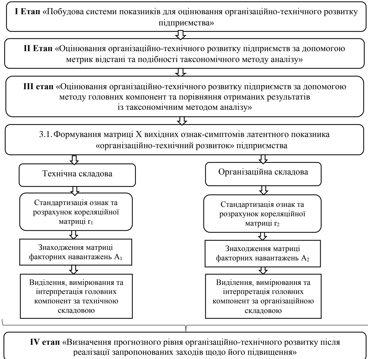
Рисунок 2 – Блок-схема проведення оцінювання організаційно-технічного розвитку підприємства

технологій утримання та годівлі тварин. Молоко, вироблене у господарствах населення, відповідає вимогам лише другого гатунку, тоді як вироблене на великих сільськогосподарських підприємствах в основному реалізується вищим і першим гатунком.