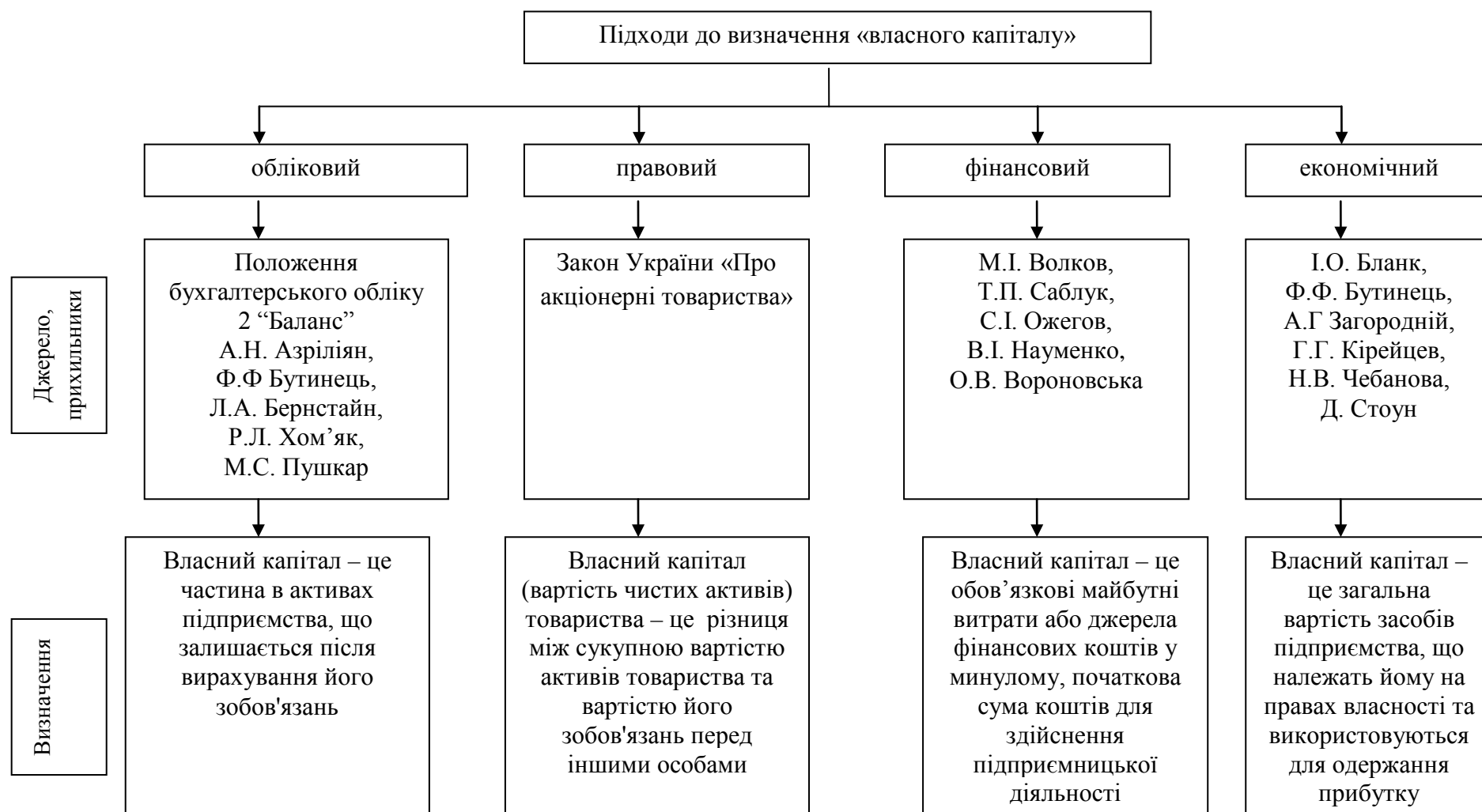
Рис. Г.1. Підходи до визначення «власного капіталу»