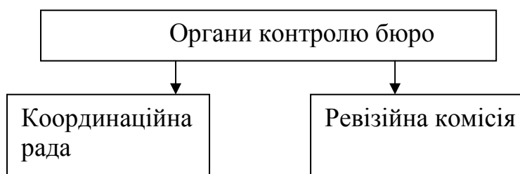
Рис 3. Схема органів контролю Медичного страхового бюро

Загальні збори членів Бюро – вищий орган з усіх питань, що стосуватимуться його діяльності. Він складатиметься з усіх страховиків - асоційованих та повних членів Бюро. Загальні збори повних членів Бюро – це орган управління, що вирішуватиме питання щодо його діяльності, в тому числі, встановлення порядку укладання та виконання договорів страхування