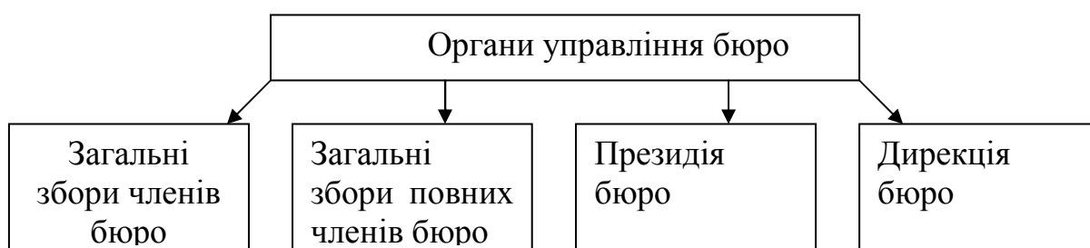
Рис 2. Схема органів управління Медичного страхового бюро

Схеми органів управління та органів контролю Медичного страхового бюро зображені на рис. 2 та 3 відповідно.