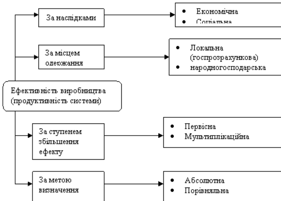
Рис.1. - Види ефективності виробництва (продуктивності системи) за окремими ознаками.

Відповідні види ефективності виробництва визначаються переважно за різноманітністю одержаних результатів (ефектів) діяльності підприємства. Перш за все результат (ефект) діяльності буває економічним або соціальним.