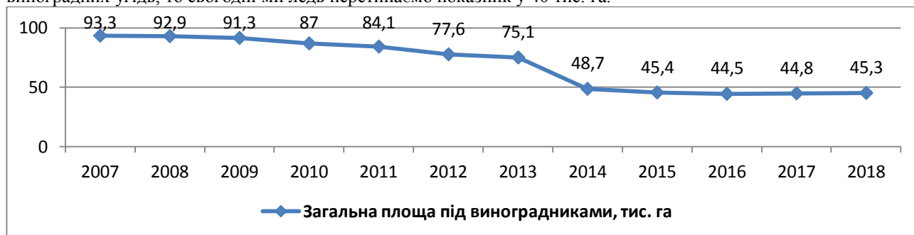
Рис.1. Площі виноградників України, тис. га

Скорочення площ виноградників в Україні обумовлює невідповідність між потребою виробництва в сировині і можливостями сировинної бази (рис.1). Якщо в 1985 році в Україні нараховувалось понад 200 тис. га виноградних угідь, то сьогодні ми ледь перетинаємо показник у 40 тис. га.