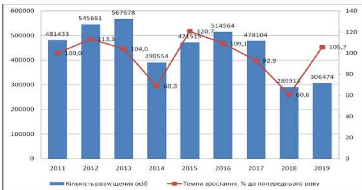
Рис. 1. Показник кількості розміщених осіб у колективних засобах розміщення в Одеській області за 2011–2019 роки

Наприклад, серед готельних підприємств України темпи зростання складали за 2011–2019 роки 65–85% відносно 2011 року, тоді як для Одеського