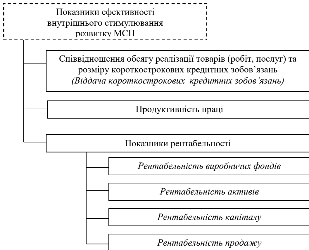
Рис. 2. Показники ефективності внутрішнього стимулювання розвитку малих і середніх підприємств

Проведений аналіз діяльності 30 малих і середніх підприємств Одеського регіону за період 2005-2008рр., які відібрано простим випадковим відбором, показав, що на більшості з них спостерігаються скорочення обсягів реалізації, збитковість, низька забезпеченість власними коштами та довгостроковими кредитними ресурсами. Підприємства не мають можливості розвиватися через відсутність довгострокових кредитів на здійснення техніко-технологічного розвитку, не можуть одержати стартовий капітал та оновити виробництво й обладнання.