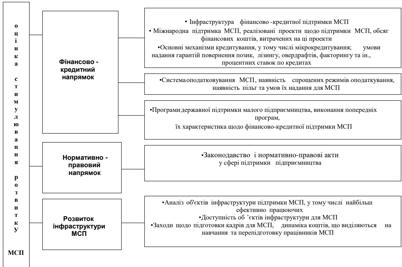
Рис.1. Складові системи оцінювання ефективності стимулювання розвитку малих і середніх підприємств на зовнішньому рівні за основними напрямками

Етапи оцінювання ефективності стимулювання розвитку малих і середніх підприємств на загальнодержавному та регіональних рівнях за основними напрямками наведено на рис.1.