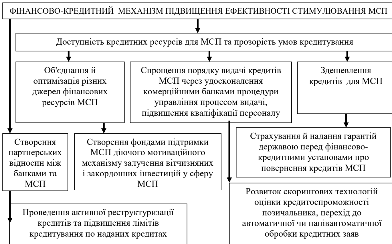
Рис. 4. Фінансово-кредитний механізм підвищення ефективності стимулювання розвитку малих і середніх підприємств

Запропоновано заходи щодо створення партнерських відносин між державними структурами, комерційними банками та малими і середніми підприємствами, а саме: проведення активної реструктуризації та підвищення лімітів кредитування по наданих кредитах. Основними напрямками використання державних ресурсів повинні стати страхування й надання їм гарантій під кредит та під реальні заходи інноваційного розвитку, здешевлення лізингових платежів. Підтримка малих і середніх підприємств повинна бути надана на конкурсній основі у відборі проектів з урахуванням відповідності їх змісту пріоритетним напрямкам регіонального розвитку, визначеним органами місцевого самоврядування, на умовах повернення, платності з обов'язковим моніторингом впровадження проекту. Для реалізації даних напрямків повинні бути залучені не тільки кошти державного бюджету, а й приватний капітал. Це дасть змогу здійснювати гнучке державне регулювання, оптимально використовувати державні ресурси.