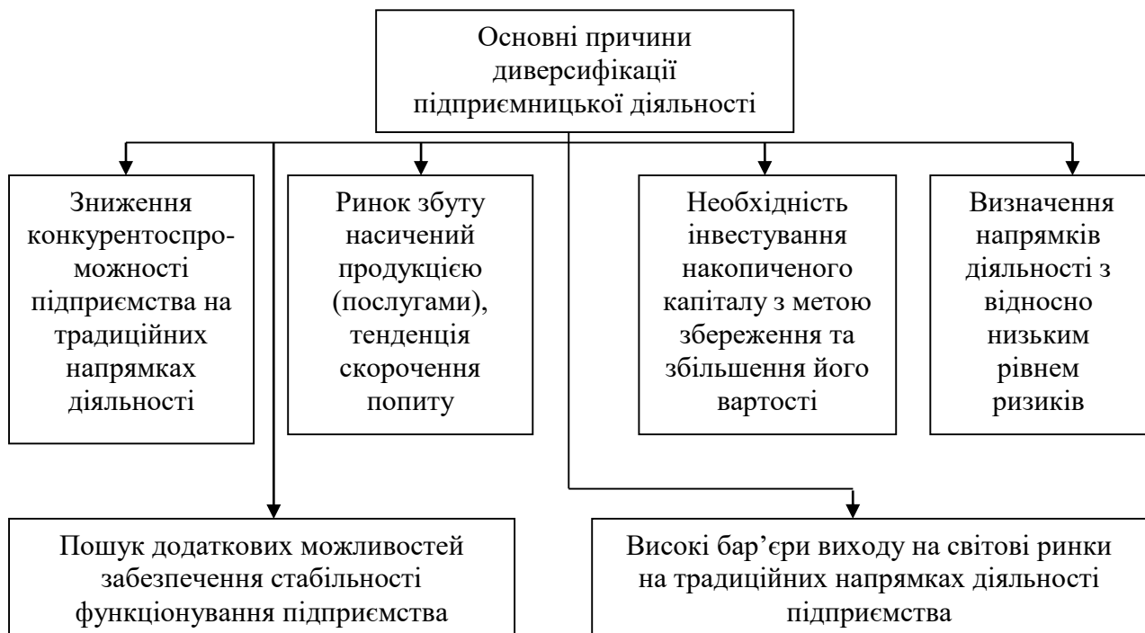
Рис. 1 – Основні причини диверсифікації підприємницької діяльності: (розроблено автором на основі [12])

На рис. 1 наведений перелік основних причин диверсифікації підприємницької діяльності: