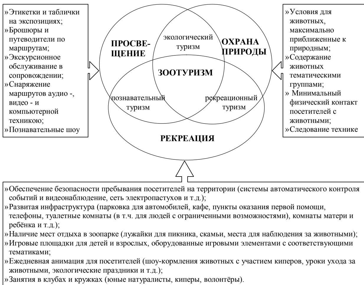
Рисунок 2 – Факторы, воздействующие на становление и развитие различных видов туризма в зоопарках

Сегодня, благодаря ведению хозяйственной деятельности зоологические парки активно влияют на показатели экономической активности городов, регионов и даже целых государств, что отражается в: