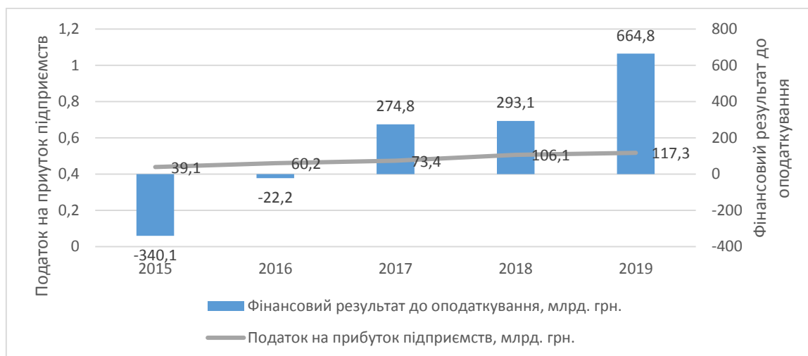
Рис. 2. Динаміка фінансового результату до оподаткування та суми сплаченого податку на прибуток підприємств [2]

При розрахунку податку на прибуток враховується фінансовий результат підприємств до оподаткування, який може коригуватись на податкові різниці, в результаті чого об'єкт оподаткування може стати від'ємним. Це пояснює факт існування від'ємних значень фінансового результату підприємств, з яких тільки 26,4 % є збитковими. З 2017 р. фінансовий результат стрімко збільшується, бо не враховує тимчасово окуповані території Автономної Республіки Крим, м. Севастополя та деякі території у Донецькій та Луганській областях (рис. 2).