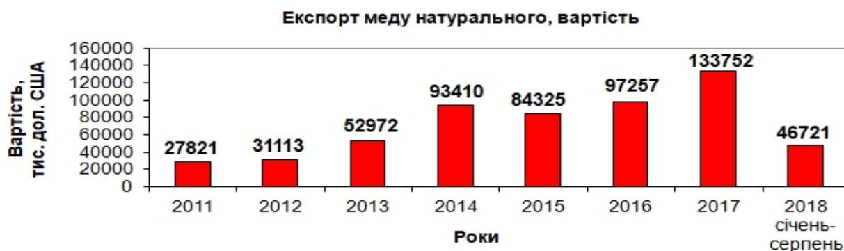
Рис. 3. Динаміка експорту меду натурального з України у 2011-2018 роках, дол. США

«Український мед», «Співдружність», «Лумелі», «Медовий край», «Діоніс мед», «Безпека Меду», «Джеса».