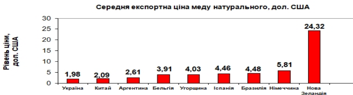
Рис. 4. Рівень середньої експортної ціни меду натурального за окремими країнами, дол. США

У той же час, перебуваючи одним з світових лідерів з експорту меду, Україна продає мед за самою низькою у світі ціною (рис. 4) [4], оскільки український мед належно не сертифікований, на має необхідного маркування та належної упаковки і продається за ціною не кінцевого товару, а в якості сировини. Ціна на внутрішньому ринку в Україні іноді даже вище – 1,5-3 дол. США.