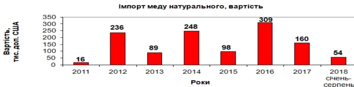
Рис. 5. Динаміка імпорту меду натурального до України у 2011-2018 роках, дол. США

Незначні обсяги високоякісного меду Україна імпортує переважно з Чехії та США (рис. 5), але вони навіть не співставляються з величезними обсягами експорту меду з України.