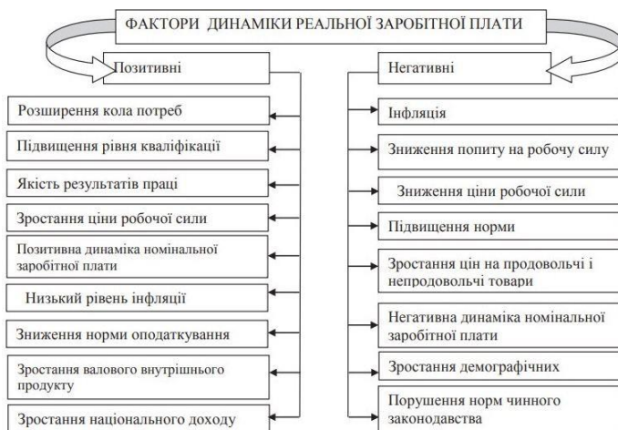
Рис. 2. Чинники, що впливають на рівень реальної заробітної плати [9]

На рівень реальної заробітної плати впливають фактори, які мають протилежну дію (рис. 2).