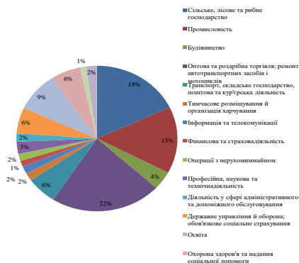
Рис.1. Структура зайнятого населення за видами економічної діяльності у 2018 році

Більш детальний огляд у структурі зайнятого населення за видами економічної діяльності саме у 2018 році наведено на рис. 1.