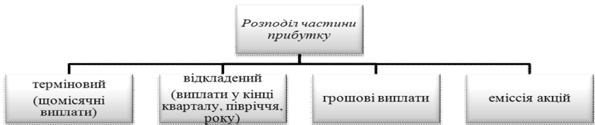
Рис. 1. Види розподілу частини прибутку між працівниками

«Участь у прибутку» за визначенням Міжнародного конгресу підприємців - це відповідна виплата, яка підготовлена і розроблена за спеціально складеною роботодавцем схемою, і яку не можна змінювати, не зачіпаючи матеріальних інтересів співробітників, рис.1 [1].