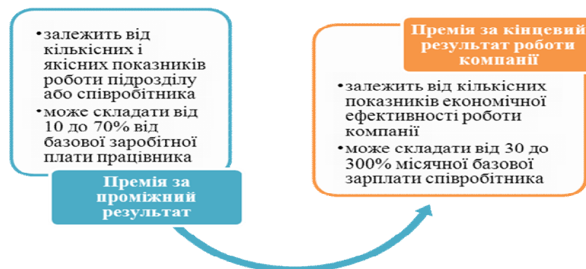
Рис. 3. Різновиди премій у системі участі у прибутках підприємства

У системі «Участь в прибутках» премії виплачуються за досягнення конкретних результатів виробничої діяльності підприємства: підвищення продуктивності праці і зниження витрат виробництва. Нараховуються премії пропорційно заробітній платі кожного з урахуванням особистих і трудових характеристик виконавця: виробничий стаж, відсутність запізень і прогулів, раціоналізаторська діяльність, вірність фірмі тощо.