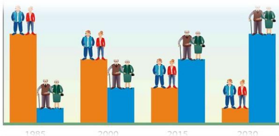
Рис. 2. Динаміка рівня старіння населення України

По-третє, політичні події та військові дії в Україні, впливаючи на демографічні реалії, посилюють гендерний баланс населення, що загрожує втратою репродуктивного та трудового потенціалу країни, зростаючим відпливом осіб працездатного віку за кордон.