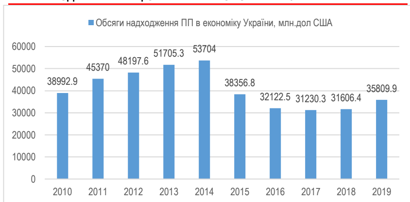
Рис. 1. Обсяги надходження ПІІ в економіку України, млн.дол США