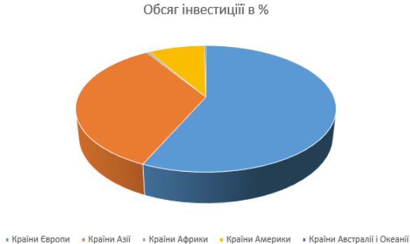
Рис. 3 Структура прямих іноземних інвестицій в економіку України за країнами світу на 31 грудня 2019 р. [8]

по об'єму ПІІ, але у 2019 році це вже 56,7% від усього обсягу. Країни Азії складають 34,3% від усього обсягу. Країни Америки – 8,4%, країни Африки – 0,4%. І найменшу частину мають країни Австралії та Океанії обсяг який складає 0,1%. Важливо відзначити що за період 2018 – 2019 рр. обсяг за країнами зберігає свої об'єми з невеликими коливаннями.