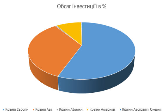
Рис. 2 Структура прямих іноземних інвестицій в економіку України за країнами світу за 2018 р. [8]

Для того щоб уявити собі ситуацію в загалом, слід звернутися до рис. 2 на якому ми маємо більш точніше представлення про структуру прямих іноземних інвестицій в економіку України за 2018 рік. Наприклад найбільше ПІІ потрапляють в Україну з країн Європи які складають 56,1% від усього обсягу. Найменший обсяг від усіх ПІІ мають країни Австралії і Океанії.