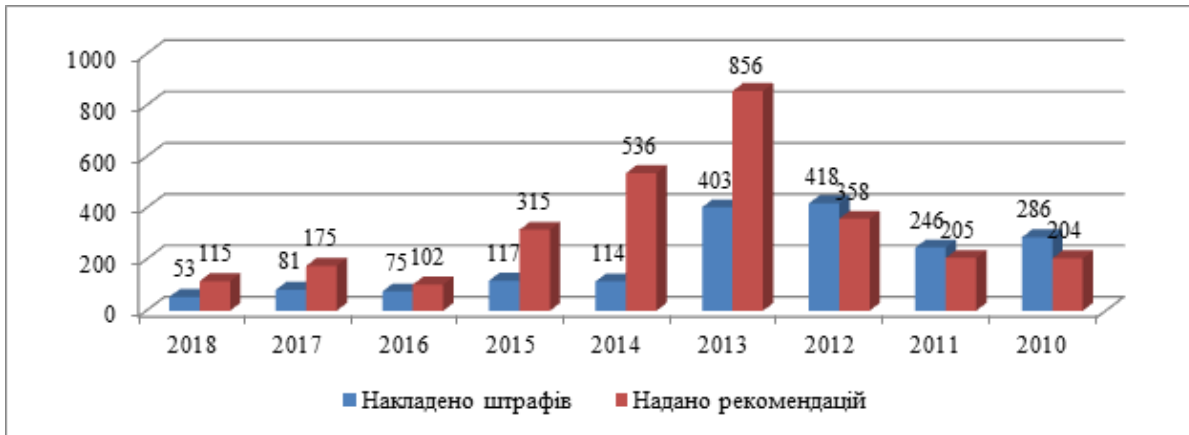
Рис. 1. Порушення АМКУ у сфері недобросовісної конкуренції (накладені штрафи та надані рекомендації), 2010–2018 рр.

Як вже було зазначено вище, головним органом з регулювання конкуренції є Антимонопольний комітет, який, відповідно до статті 7 Закону України «Про Антимонопольний комітет України», має в компетенції проведення досліджень ринку, визначення меж товарного ринку, монопольного становища суб'єктів господарювання [1, с. 104]. На рис. 1 наводиться динаміка кількості припинених АМКУ порушень у сфері недобросовісної конкуренції.