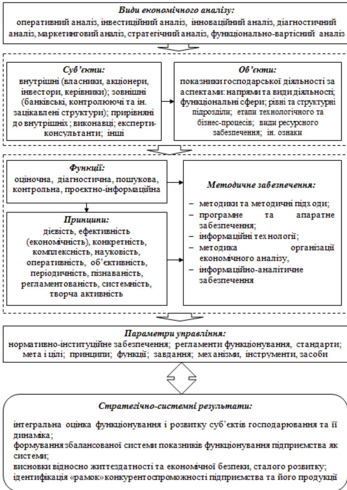
Рис. 1 Система економічного аналізу суб'єктів господарювання