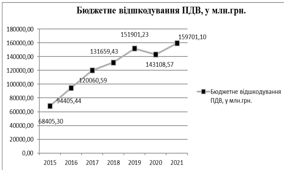
Рис. 1. Фактичний обсяг відшкодування ПДВ в Україні за 2015-2021 роки

Фактичний обсяг відшкодування ПДВ в Україні за 2015-2021 роки наведено на рис. 1.