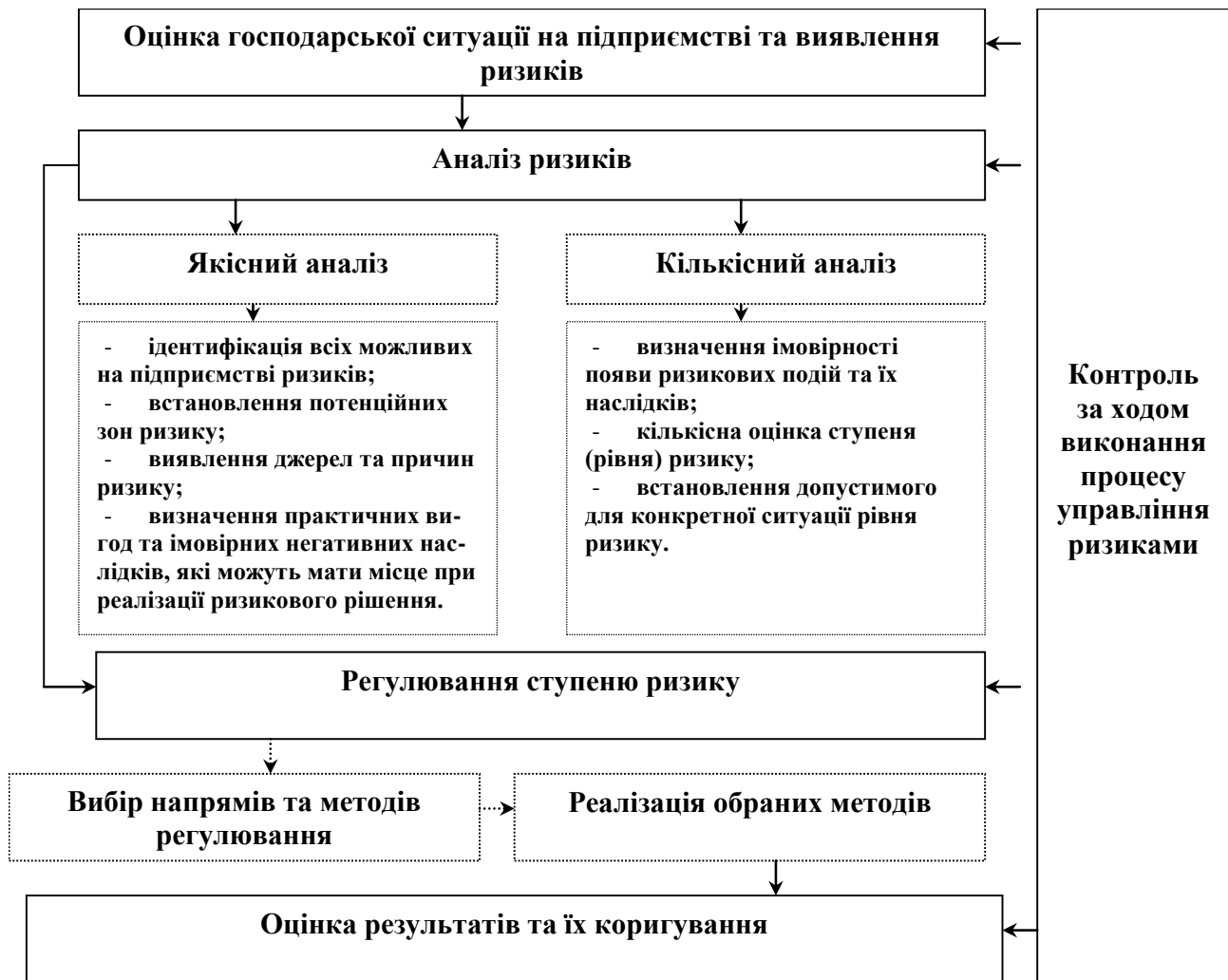
Рис. 8.1. Процес управління ризиками господарської діяльності на підприємстві

На першому етапі ризик-менеджменту доцільним є оцінка господарської ситуації та виявлення всієї сукупності ризиків, їх джерел, об'єктів. Спочатку визначають найбільш ймовірні й небезпечні ризики та поступово переходять до найменш ймовірних, формуючи портфель ідентифікованих ризиків.