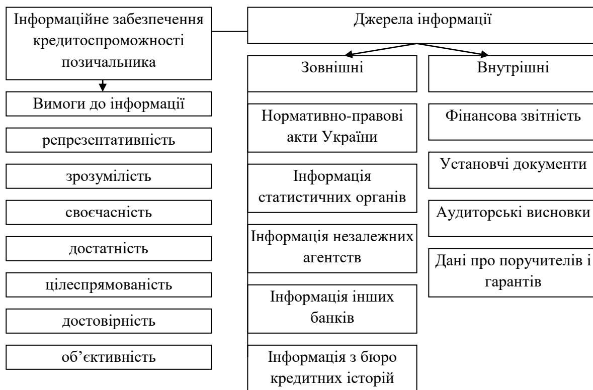
Рис. 1 Інформаційне забезпечення кредитоспроможності позичальника [2, с. 202]

Важливим джерелом зовнішньої інформації ж фінансова звітність позичальник. Інформацію про склад засновників, напрямки діяльності підприємства, порядок використання прибутку, структуру управління працівники банку можуть знайти в установчих документах.