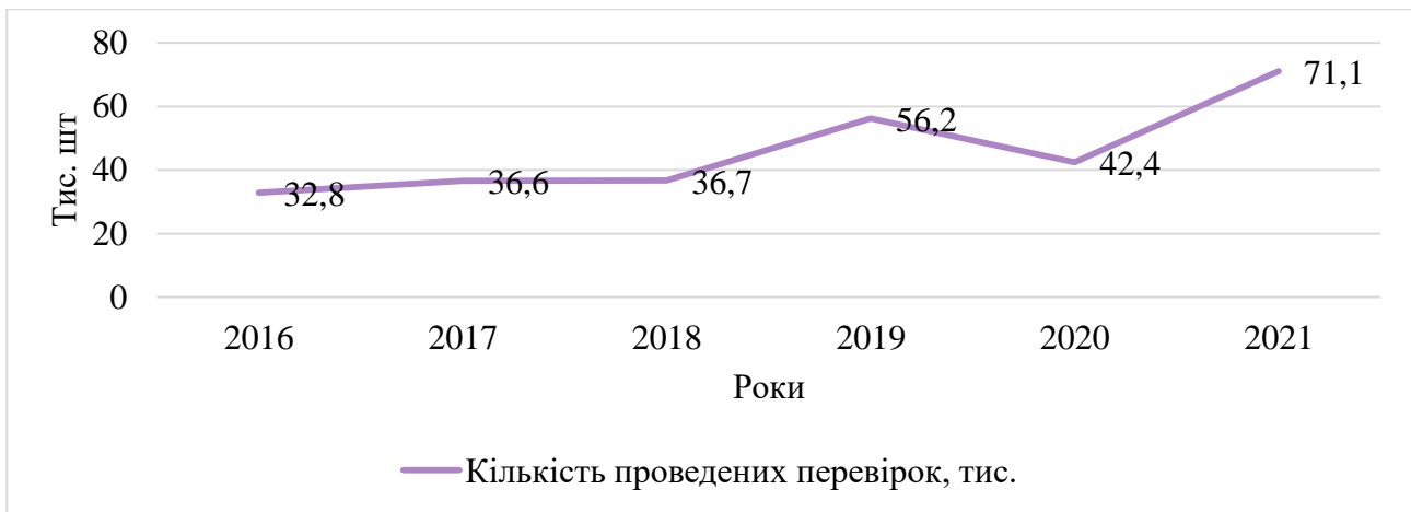
Рис. 1. Аналіз кількості податкових перевірок в Україні, 2016-2021 рр.