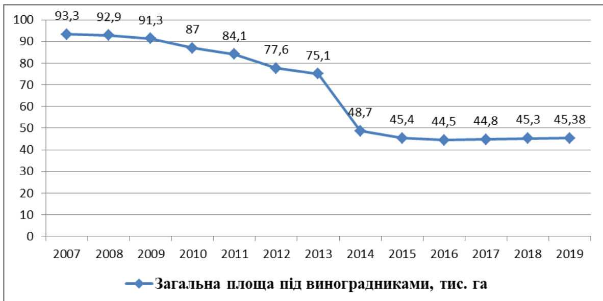
Рис. 1. Площі виноградників України, тис. га

Незважаючи на те, що в умовах скорочення площ виноградних насаджень підвищується виробництво винограду за рахунок зростання інтенсивності та поліпшення організаційно-економічних чинників виробництва, потреба у виноматеріалах задоволена не повністю, тому виноробні підприємства змушені імпортувати виноматеріали [2, с. 147]. Сьогодні необхідне поступове зниження імпорту виноматеріалів з одночасним розвитком вітчизняної сировинної бази шляхом запровадження інноваційних технологій виробництва винограду, зростання врожайності й підвищення якості продукції.