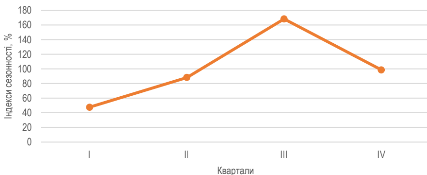
Рис. 1. Сезонна хвиля рівня в'їзного туризму.