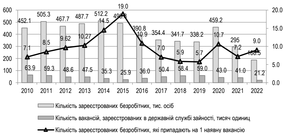
Рис. 1. Попит та пропозиція на ринку праці в Україні за 2010-2022 рр., станом на кінець року

Співвідношення між попитом і пропозицією на трудові ресурси утворює ринок праці. Попит на трудові ресурси найчастіше виражається в кількості вакансій, які зареєстровані в державній службі зайнятості. Пропозиція на ринку праці визначається кількістю зареєстрованих безробітних. Співвідношення попиту та пропозиції представлено на рис. 1.