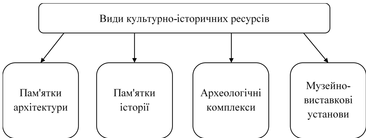
Рис. 1. Види культурно-історичних ресурсів

Культурно-історичні туристичні ресурси: об'єкти антропогенного характеру, які є матеріальним втіленням історичних і культурних (в широкому сенсі цього поняття) процесів, що проходили на певній території, які мають привабливі характеристики для їх використання при формуванні туристичного продукту. Культурно-історичні ресурси охоплюють все соціокультурне середовище місцевості: історичні події, архітектуру, традиції, звичаї, особливості господарського життя та ін. (рис. 1).