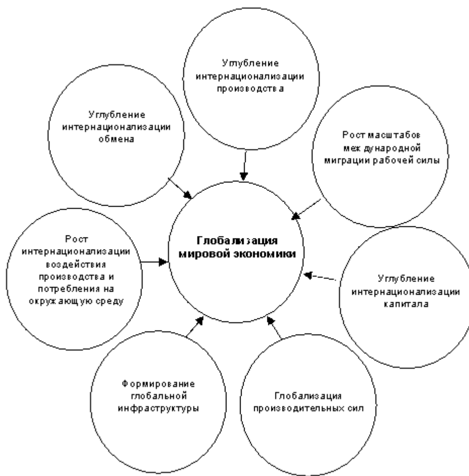
Рис. 2 Компоненты глобализации мировой экономики [1]

Некоторые специалисты отмечают, что экономическая глобализация – это кульминационный момент в историческом процессе распространения рыночных капиталистических принципов хозяйствования в планетарном масштабе. Глобализация создает эффекты и связи, выходящие за пределы национальных границ, и они как волны распространяются по всей системе мирового хозяйства.