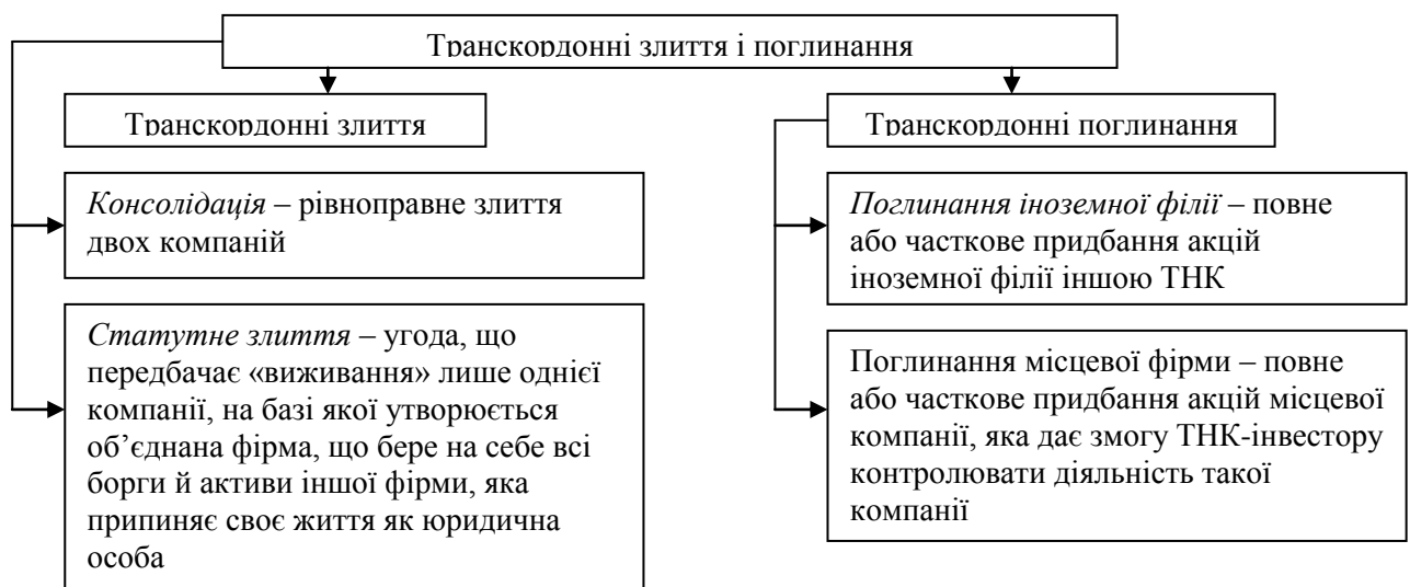
Рис. 1 – Форми транскордонних М&А [2]

Злиття можуть набирати форми консолідації або статутного злиття, а поглинання розподіляються на поглинання іноземних філій і місцевих фірм (рис.1).