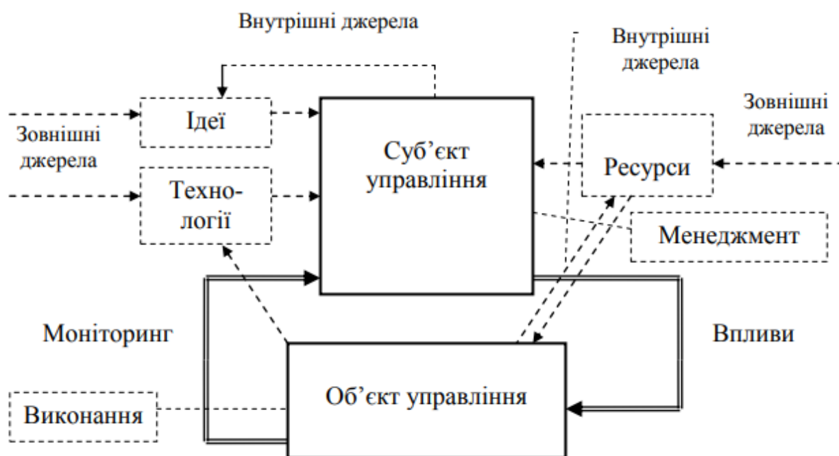
Рис. А. 1. Модель циклу управління з виділенням узагальнених чинників впливу на процеси самоорганізації