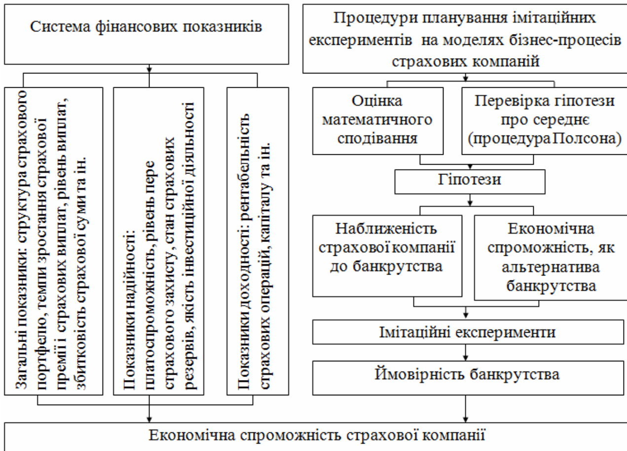
Рис. 3. Структурологічна схема оцінки економічної спроможності страховика

Таким чином, висновок відносно економічної спроможності страхової компанії в імітаційній моделі здійснюється як на базі стандартних фінансових показників, так і за наслідками проведених імітаційних експериментів (рис. 3).