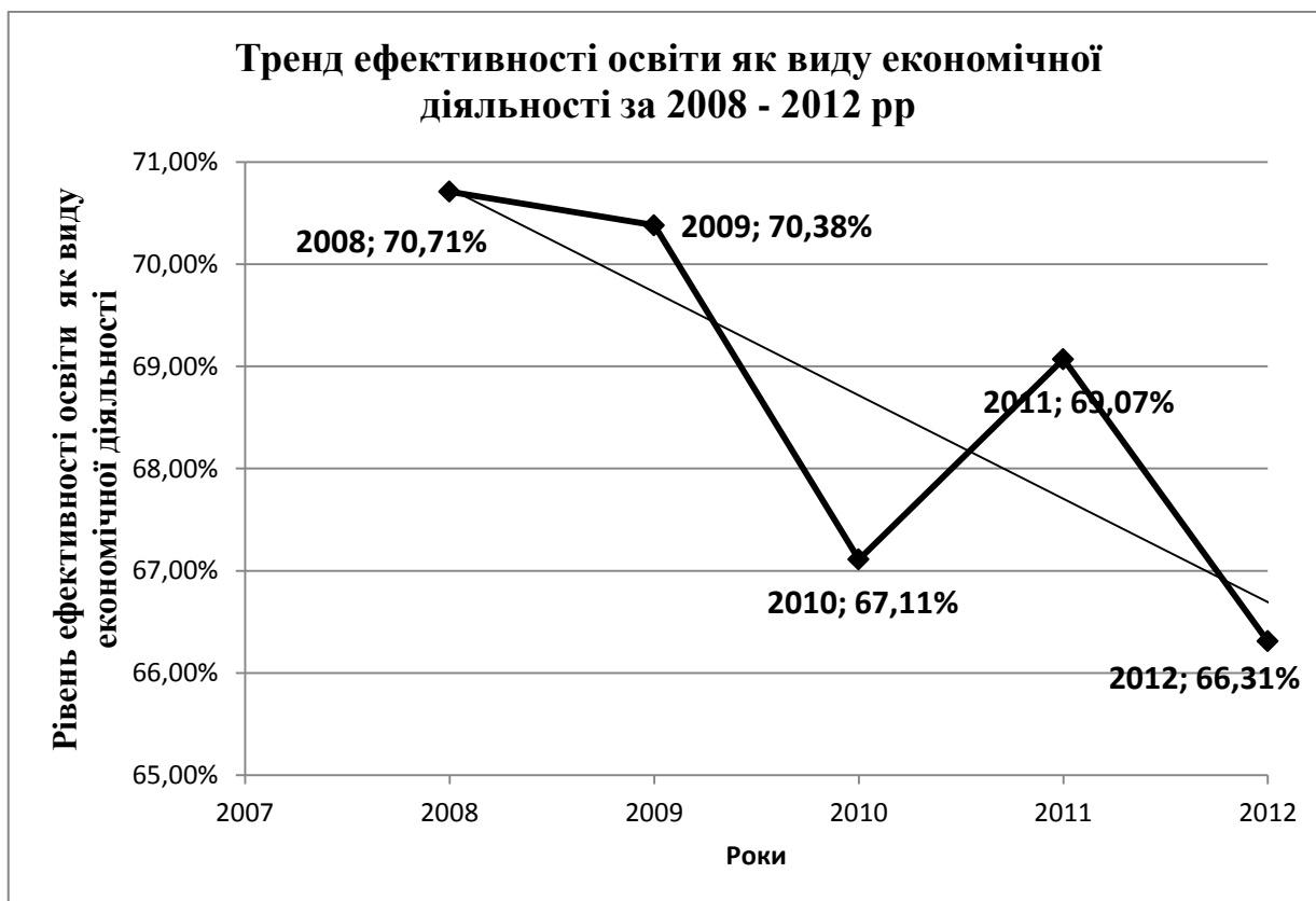
Рис. 3. Тренд ефективності освіти як виду економічної діяльності за 2008 - 2012 рр.