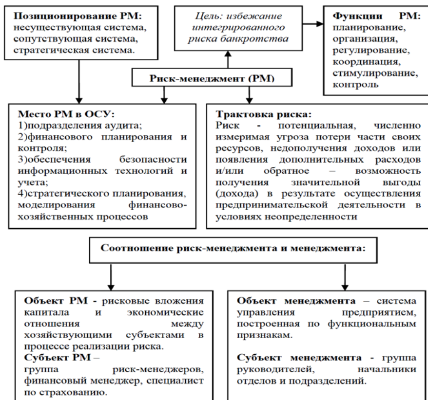
Рис. 1 Основы формирования системы риск-менеджмента на предприятии

Возможно три типа позиционирования риск-менеджмента в системе управления: несуществующая система, сопутствующая система, стратегическая система. Идентификация соотношения риск-менеджмента и менеджмента на основе сопоставления их субъектов и объектов имеет следующий вид (рис. 1).