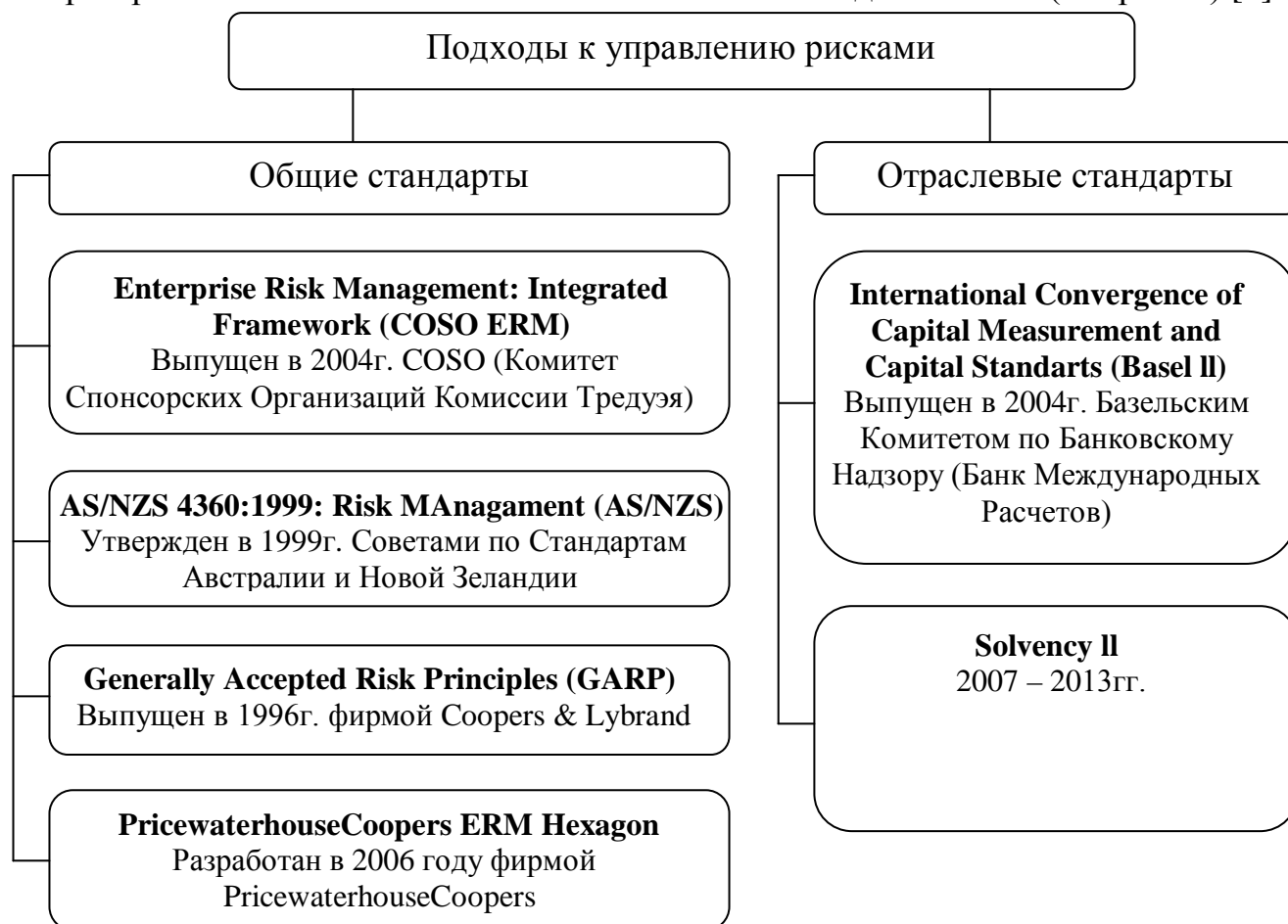
Рис. 1. Стандарты интегрированного риск-менеджмента ERM