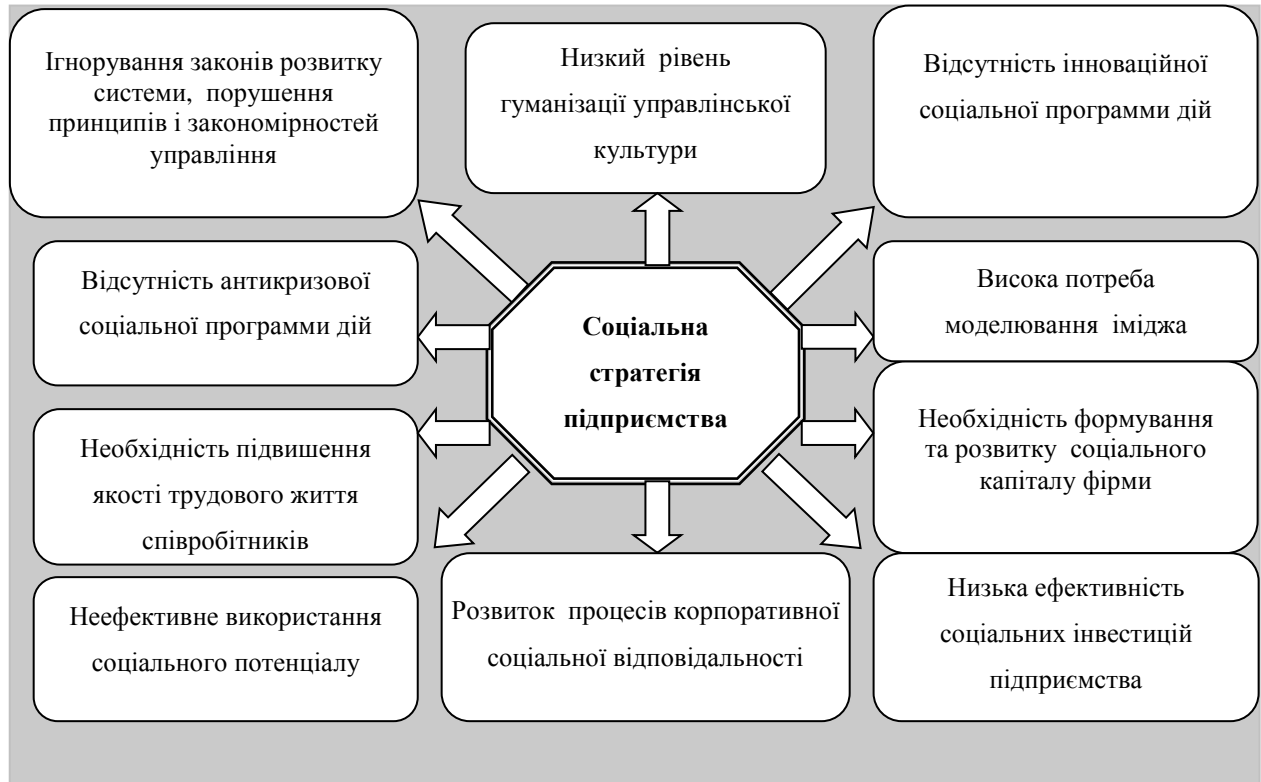
Рис. 1. Причини, що визначають важливість формування соціальної стратегії підприємства.

Важливість формування соціальної стратегії визначається певними причинами, які представлені на рис. 1.