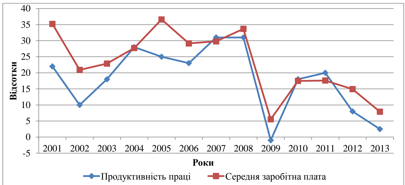
Рис. 3. Темпі зміни продуктивності праці та середньої заробітної плати в Україні за 2001-2013 рр..

2000 р., притому що продуктивність праці підвищилася за той же період на 12,8%. [7]. Таким чином, спираючись на дані про оплату праці в 36 країнах було розраховано, що з 1999 р. у розвинутих країнах зростання продуктивності праці в середньому більш ніж удвічі перевищило зростання середньої заробітної плати. Це з одного боку, говорить про значні резерви економічного росту та можливості ще підвищувати рівень заробітної плати, а з іншого, ще раз підтверджує скорочення долі праці у системі доходів. Треба відмітити, що на Україні спостерігається протилежна тенденція: середня заробітна плата зростає швидше ніж продуктивність праці. Тільки у період фінансової кризи 2008-2009 років цей процес сповільнився, але вже за даними 2013 року продуктивність праці зросла на 2,5%, а заробітна плата – на 8,2% (рис. 3). Такий розрив показує існування прихованих економічних проблем у країні і в подальшому може призвести до нової кризи у вигляді девальвації національної валюти.