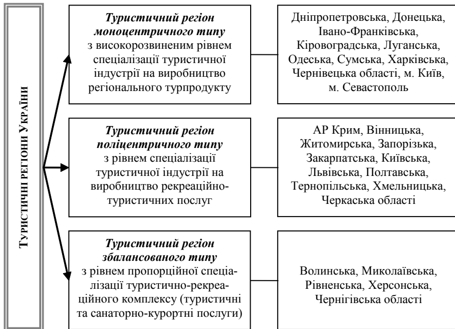
Рис. 1. Типологія туристичних регіонів України [8, с. 65]

при визначенні поняття «туристичний регіон» слід вважати регіональну парадигму, яка склалася в науці, враховувати основні чинники, які дадуть змогу поширити дослідження з визначення сучасного стану класифікації, типології та визначення суті поняття «туристичний регіон». Відзначимо, що для вирішення вже виділених в науці критеріїв типології туристичних регіонів України пропонується доповнити наявні методики, а саме поділ регіонів за критеріями спеціалізації, які мають відношення до територіально-галузевої структури туристично-рекреаційних комплексів регіонів, для подальшого впровадження комбінаційно-аналітичного групування туристичних регіонів за такими ознаками та типами, які, на наш погляд, відповідають основним принципам концепції «зелена економіка»: туристично-моноцентричні, туристично-поліцентричні, туристично-збалансовані [8, с. 64-66] (рис. 1). Обґрунтуванням для запропонованої типології є такі обставини. Рівень туристично-моноцентричних регіонів відображає досягнутий у процесі функціонування туристично-рекреаційного комплексу економічний результат за рахунок ступеня зорієнтованості туристичного господарства регіону на виробництво певного регіонального туристично-екскурсійного та готельного продукту, а також його потенційні масштаби.