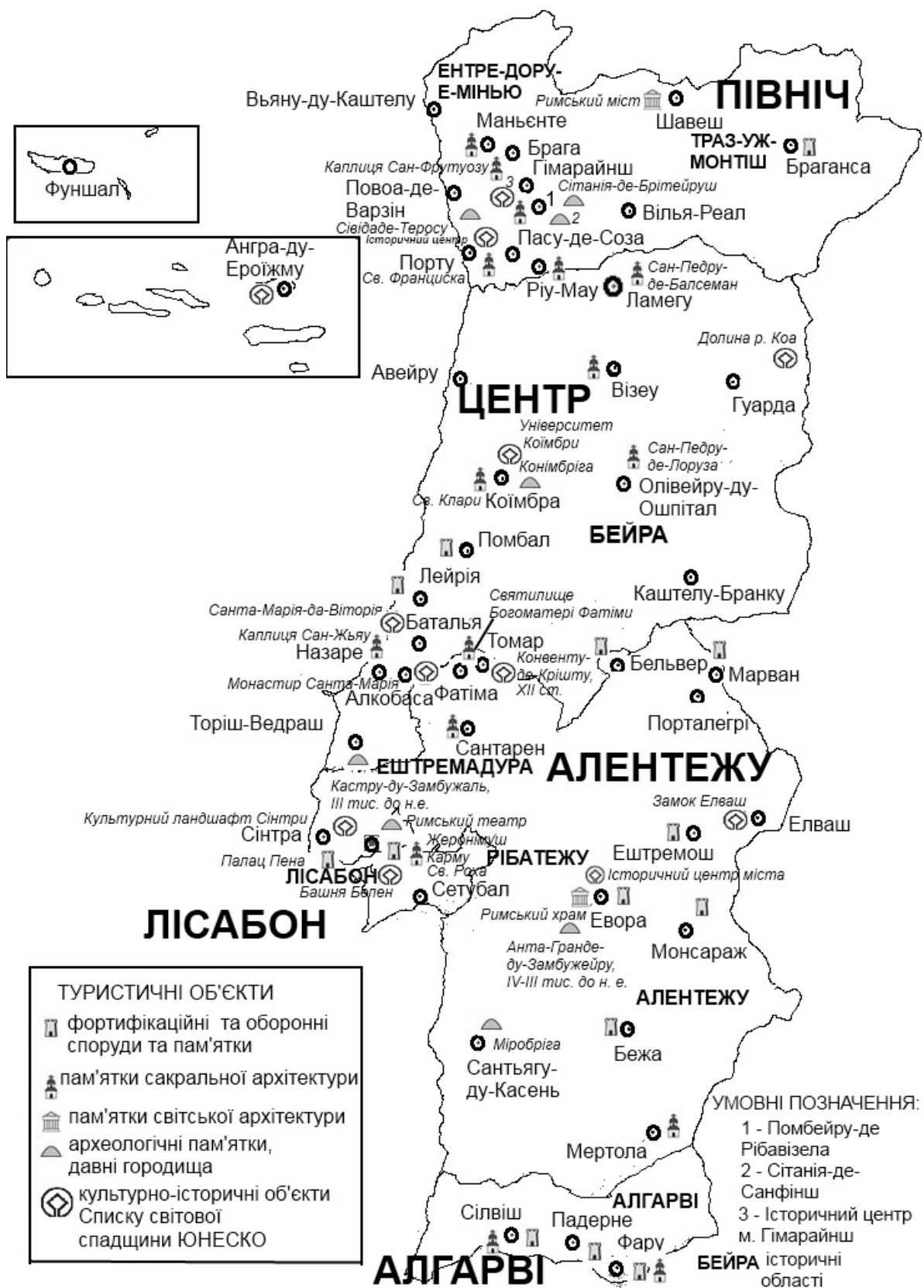
Рис. 3. Культурно-історичні ресурси Португалії (на основі [4,5,6,11,15,17])

Поблизу м. Коїмбра розміщене поселення римського періоду Конімбріга. Тут розміщений національний музей, до якого входять міцні