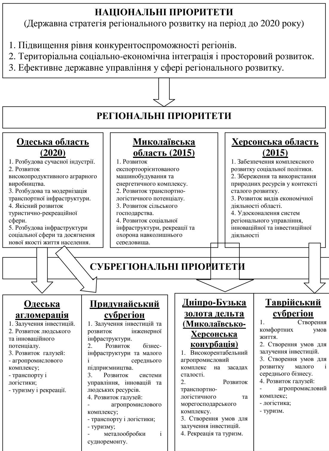
Рис. 2. Пріоритети регіонального розвитку в приморських регіонах та субрегіонах Українського Причорномор'я

Ключові стратегічні документи регіонів та субрегіонів Українського Причорномор'я були проаналізовані в розрізі відповідності інструментам новітньої регіональної політики саморозвитку (табл.1).