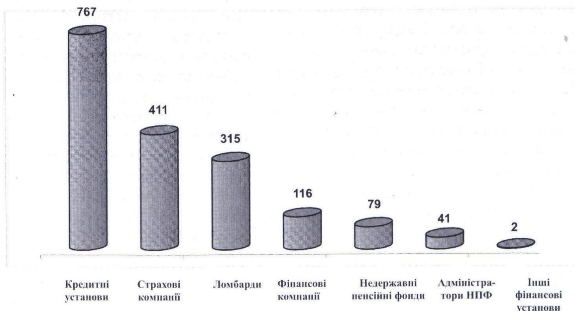
Рис. 1. Кількість небанківських фінансових установ в Україні станом на 01.01.2007 р. [5]

Необхідно відмітити, що активи фінансових посередників в Україні здебільшого представлені банківськими установами та значно меншою мірою страховими компаніями. Це пояснюється відносно нетривалим проміжком часу формування ринкових відносин в Україні. Якщо сучасна банківська система почала свій розвиток з 1991 року, поступово ускладнюючи норми та методи регулювання своєї діяльності, то страховий ринок певний час не мав відповідних норм функціонування, а підвищені ризики в економіці не сприяли ефективній діяльності страхових компаній.