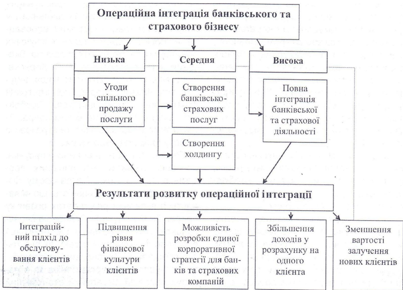
Рис. 3. Особливості та результати розвитку операційної інтеграції банківського й страхового бізнесу

бізнесі є фінанси, фінансова діяльність та рух фінансових ресурсів.