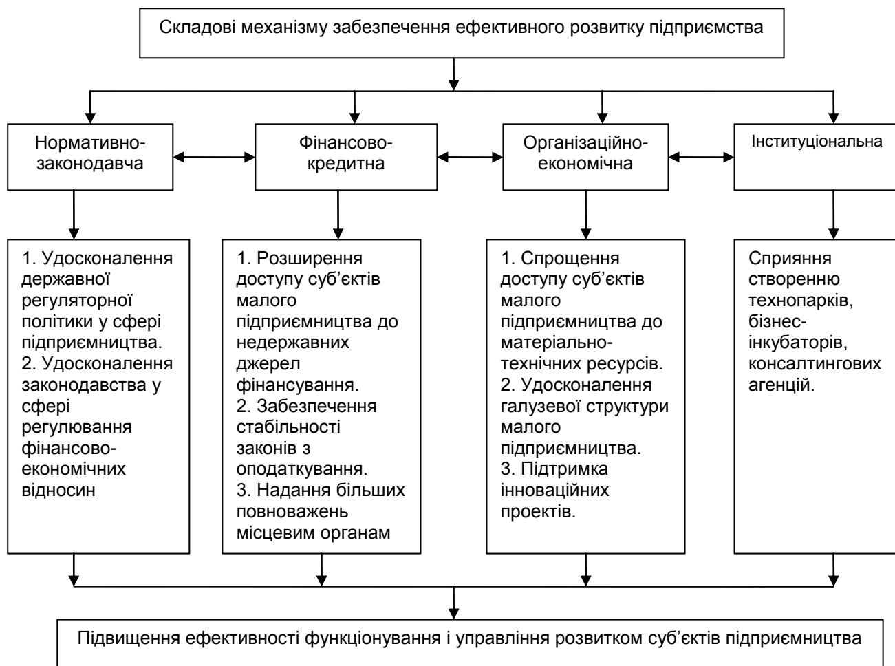
Рис 1. Складові механізми забезпечення ефективного розвитку суб'єктів малого підприємництва

Підтримка розвитку малого підприємництва повинна носити регіональний характер та враховувати рівень розвитку підприємництва в окремих районах та видах економічної діяльності.