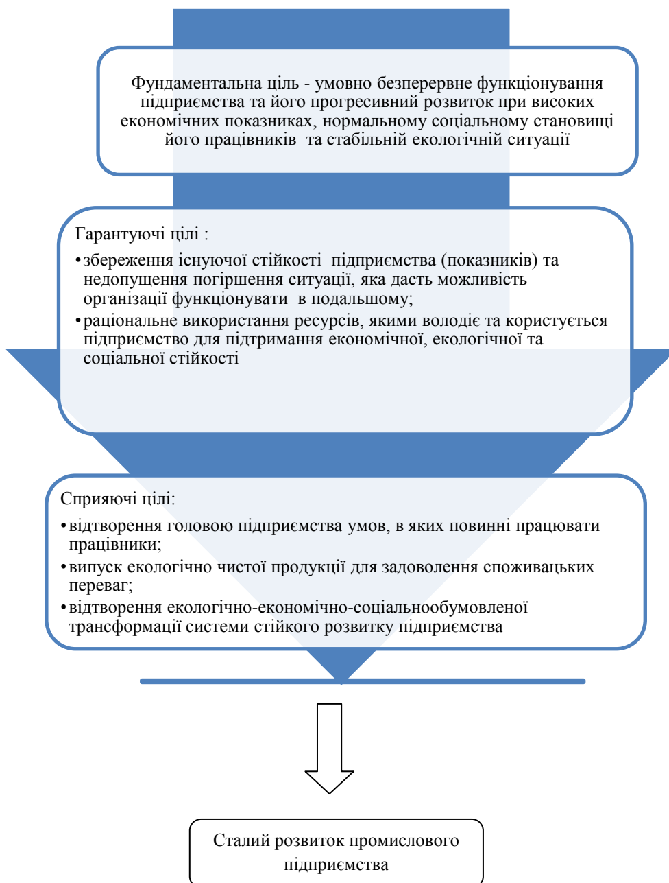
Рис. 1. Цілі сталого розвитку промислового підприємства

На малюнку видно, що економічна та соціальна системи прагнуть розвитку, росту, устрімляючись до вершини, що цілком зрозуміло, адже ціль функціонування будь-якого підприємства є отримання прибутку, який в свою чергу підвищує соціальний рівень людини.