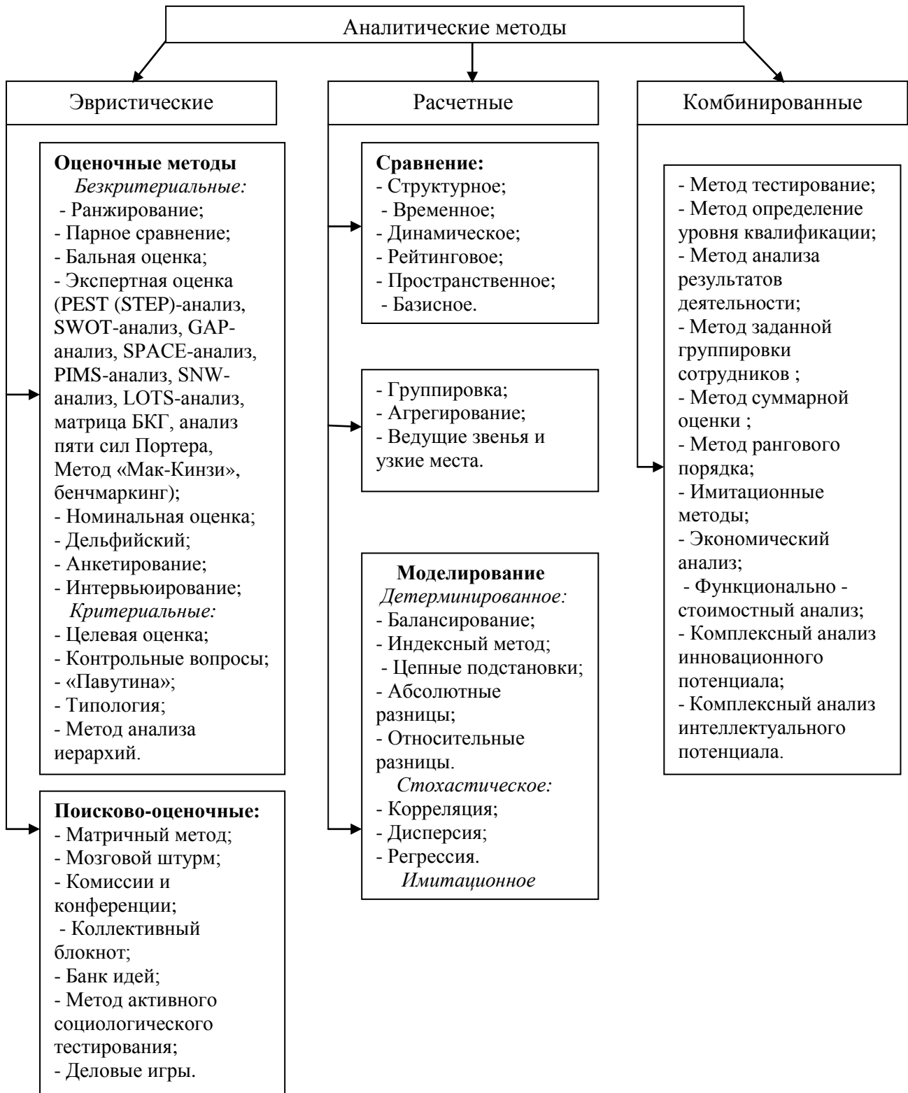
Рис.1. Классификация аналитических методов