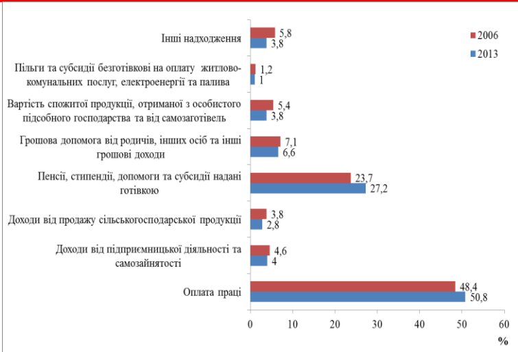
Рис.1. Структура сукупних ресурсів домогосподарств

За період з 2007 р. по 2013 р., або за 7 років, обсяг сукупних ресурсів домогосподарств України в цілому збільшився на 1057345 млрд. грн., тобто майже в 2 рази, а саме в середньому щорічно даний показник збільшувався на 132,2 млрд. грн., тобто на 15,8%. Середній обсяг доходів на душу населення з кожним роком зростає, і у 2013 склав 1917,22 грн.