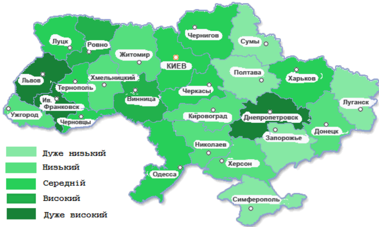
Рис. 3. Картограма регіонів України за рівнем захворюваності

Отже, проведений статистичний аналіз захворюваності населення України у 2013 році показав достатньо позитивні результати. Загалом за останні 13 років рівень захворюваності українців зменшився, а також більшість регіонів України мають низький рівень захворюваності. Отримані результати свідчать про достатній рівень розвитку сучасної медицини, але як і у всіх сферах суспільного життя є певні недоліки, на які необхідно звертати увагу, і намагатися позбутися їх.