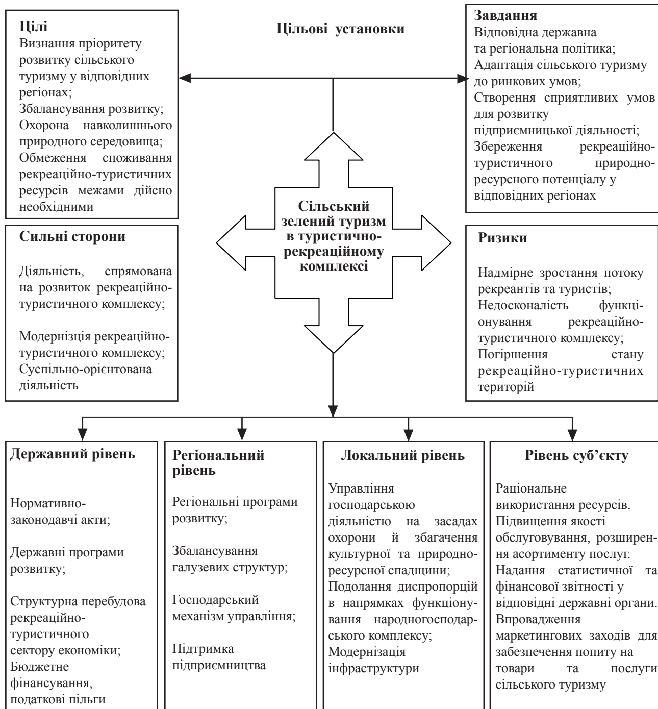
Рис. 2. Функціонально-структурна схема розвитку сільського туризму

Таким чином, з метою координації дій та подальшого розвитку підприємницької діяльності за цільовими установками бізнесу та органів державної влади, які діють за дорученням уряду в сфері регіонального розвитку, можна запропонувати схему розвитку сільського зеленого туризму в туристично-рекреаційному комплексі. Функціонально-структурна схема відображає сільський зелений туризм, як суспільно-економічне явище та засоби реалізації цільових установок (рис. 2).