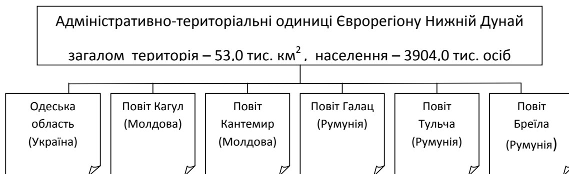
Рис. 1. Склад Єврорегіону Нижній Дунай

У 1998 р. після зустрічі Президентів України, Молдови та Румунії було вирішено створити Єврорегіон Нижній Дунай у складі Одеської області України, уїздів Кагул та Кантемир Республіки Молдова і трьох повітів Румунії – Галац, Тульча, Бреїла (див. рис. 1).